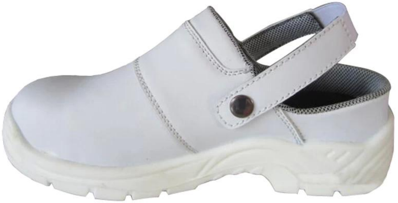
3099 Chef Sicherheit Schuhe einzigen Show: