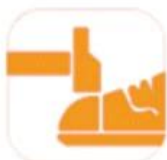
200 JOULE TOECAP