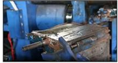
3. PVC Injection