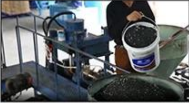
1. Mixing Materials