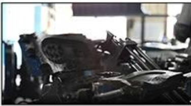
4. Open The Mould