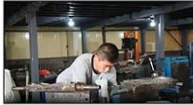
2. Putting Polyester Lining