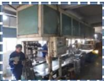
Heat - Setting