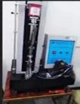
Bondness Test \geq 4.0 N/mm