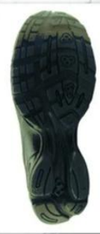
Sole style: 4000