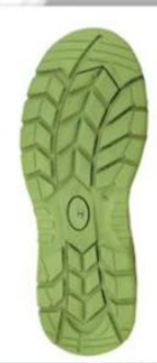
Sole style: 5000