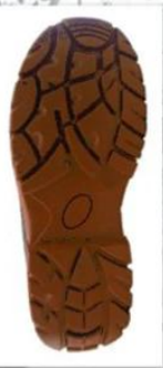
Sole style: 2015