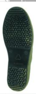
Sole style: 7000