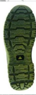
Sole style: 2016