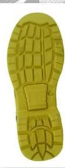
Sole style: 9000