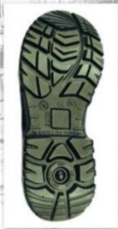
Sole style: 2017