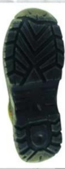
Sole style: 2000