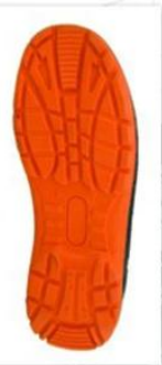
Sole style: 8000