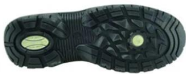
Sole style: 8080