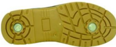
Sole style: 1000P