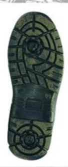
Sole style: 1000