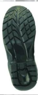
Sole style: 3000