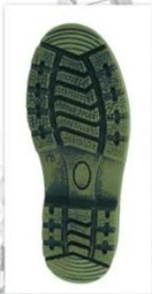
Sole style: 6000