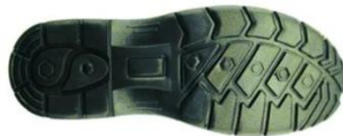
Sole style: 1001