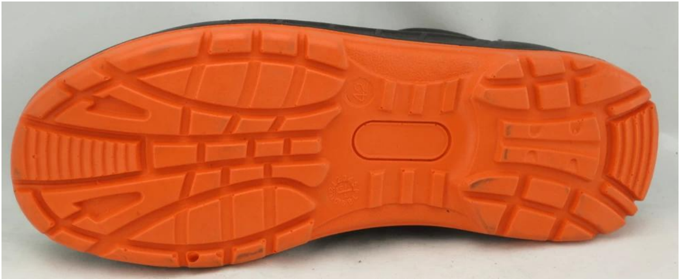
أحذية السلامة الصناعية عرض نموذج وحيد