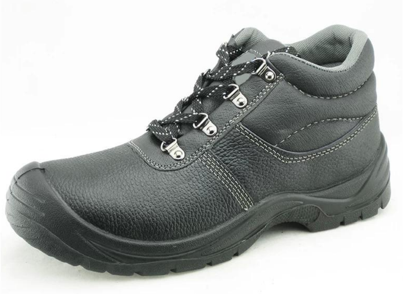
:سلامة العلامة التجارية عرض وحيد Vaultex الأحذية