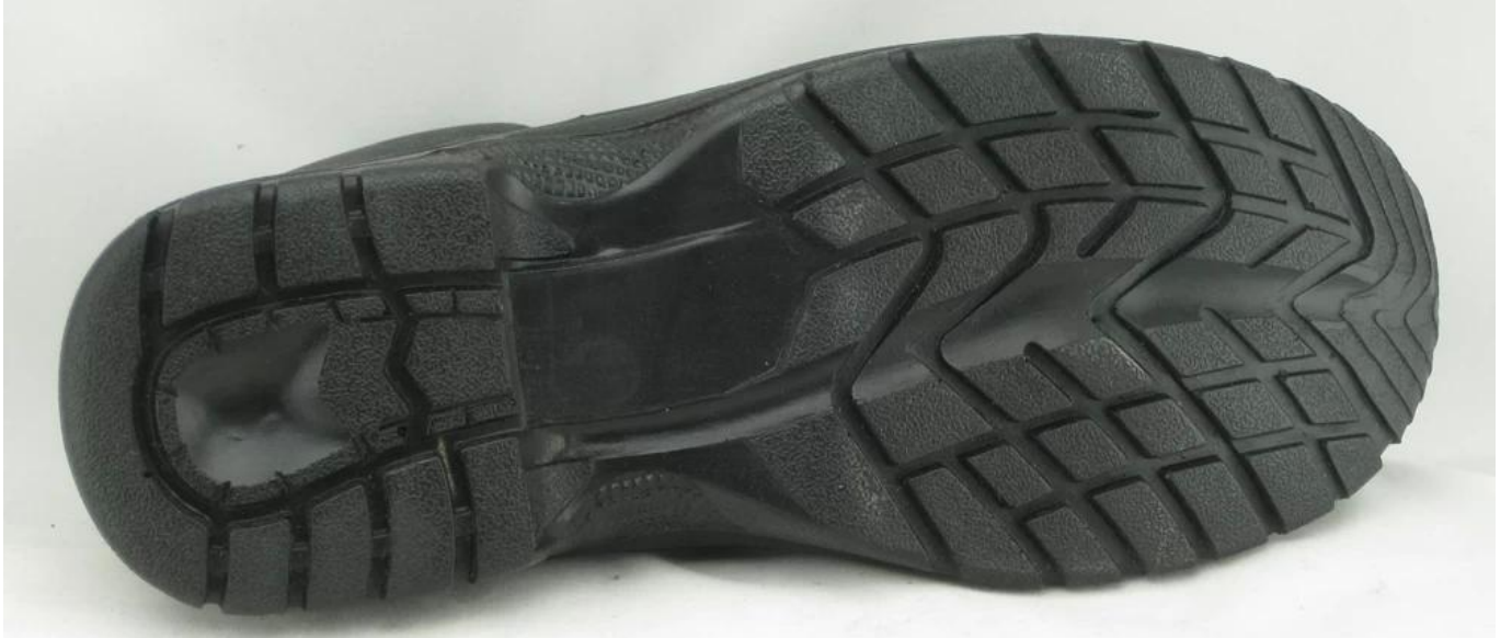
:أحذية السلامة عرض نموذج وحيد