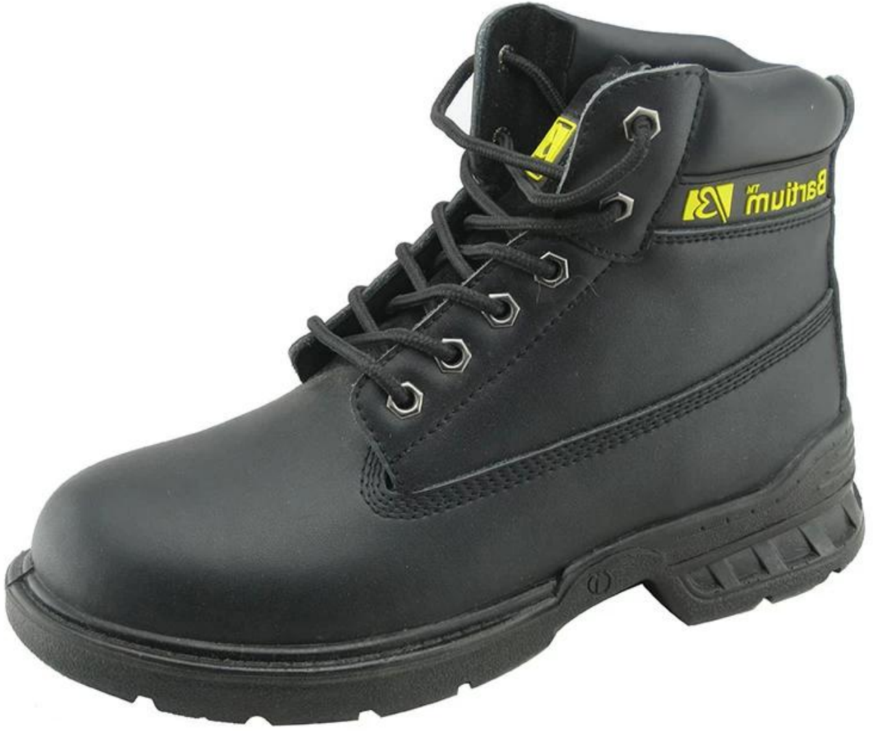
:العمل الأحذية السلامة عرض وحيد