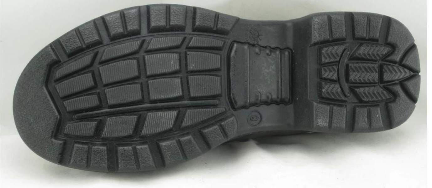
:أحذية السلامة عرض نموذج وحيد