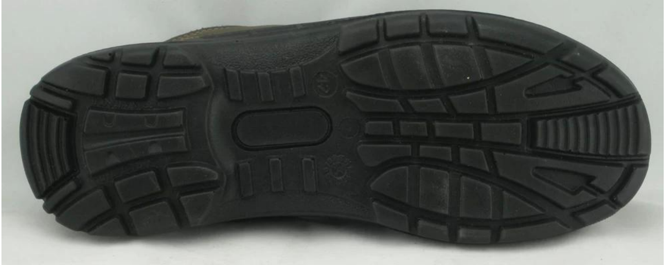
:العمل أحذية السلامة عرض نموذج وحيد