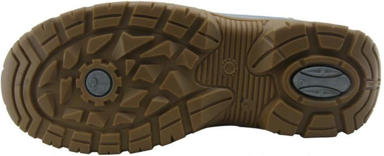
أحذية السلامة عرض نموذج وحيد