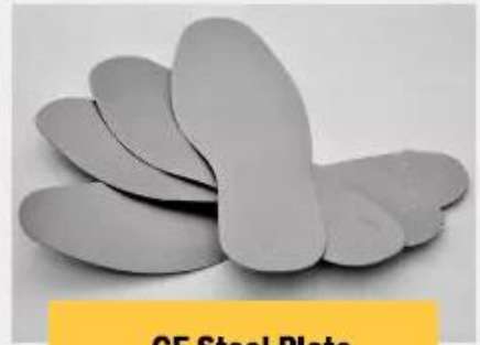
CE Steel Plate