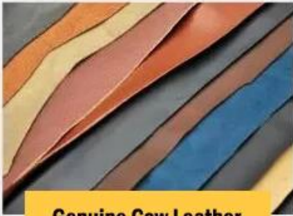
Genuine Cow Leather