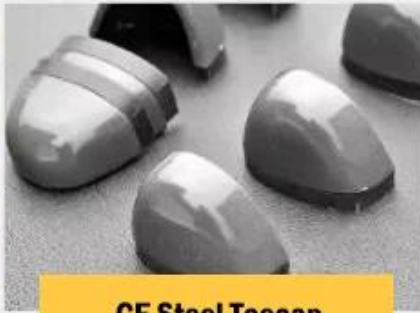
CE Steel Toecap