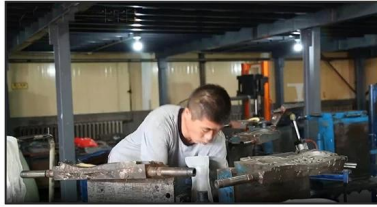
2. Putting Polyester Lining