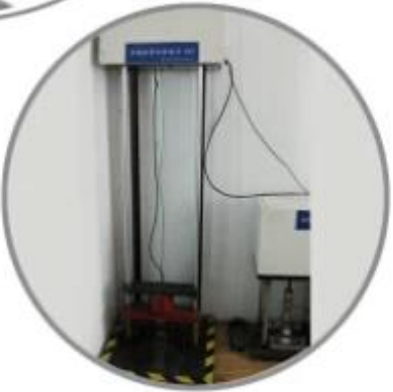
Impact Resistant Testing Machine