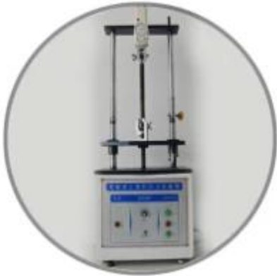
Tensile testing machine