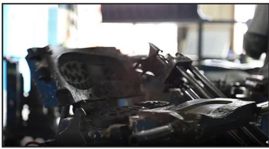
4. Open The Mould