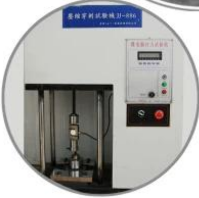
Puncture Testing Machine