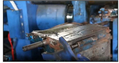
3. PVC Injection