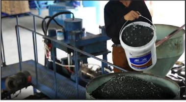
1. Mixing Materials