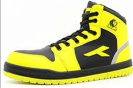
Safety Work Shoes