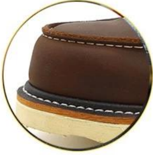
Waterproof leather upper

Removable metatomeal HI-POLY footbed provides long-lasting underfoot support and comfort.