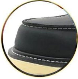
Waterproof leather upper

Removable metatomeal HI-POLY footbed provides long-lasting underfoot support and comfort.