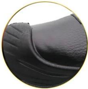
Waterproof cow leather upper

Removable metatomical HI-POLY footbed provides long-lasting underfoot support and comfort.