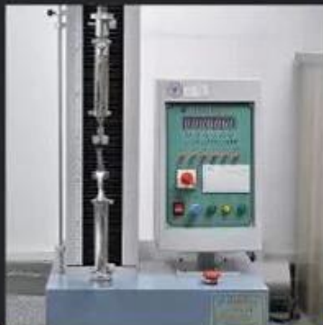
Tear Strength \geq 120 N