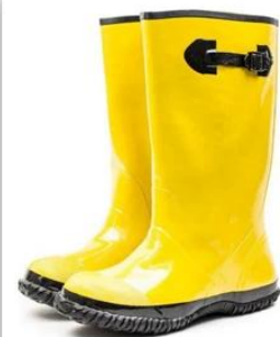
Yellow Slush Boots