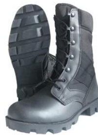
Military Army Boots