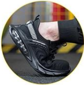
Breathable Mesh Upper

Breathable & Comfortable Uppers Compared with the traditional steel toed leather shoes , the fly weavingshoes are more breath and comfortable , and it will better fit your feet.