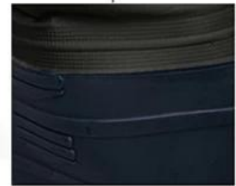
Heat Seal Technique