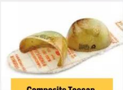
Composite Toe cap