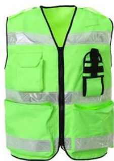
Reflective Safety Vest