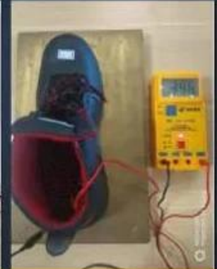
ESD Anti-Static Test