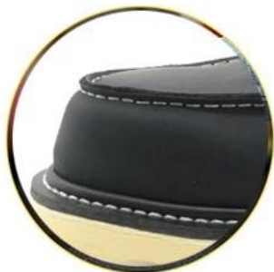
Waterproof leather upper

Removable metatological HI-POLY footbed provides long-lasting underfoot support and comfort.