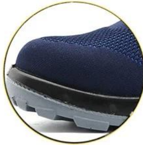
Breathable 3D fly knit fabric