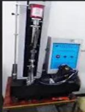
Bondness Test \geq 4.0 N/mm