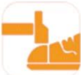
200 JOULE TOECAP