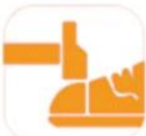
200 JOULE TOECAP