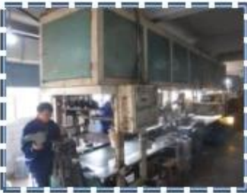
Heat - Setting