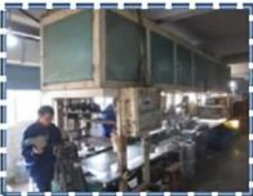
Heat - Setting