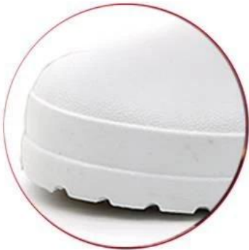
Waterproof EVA upper