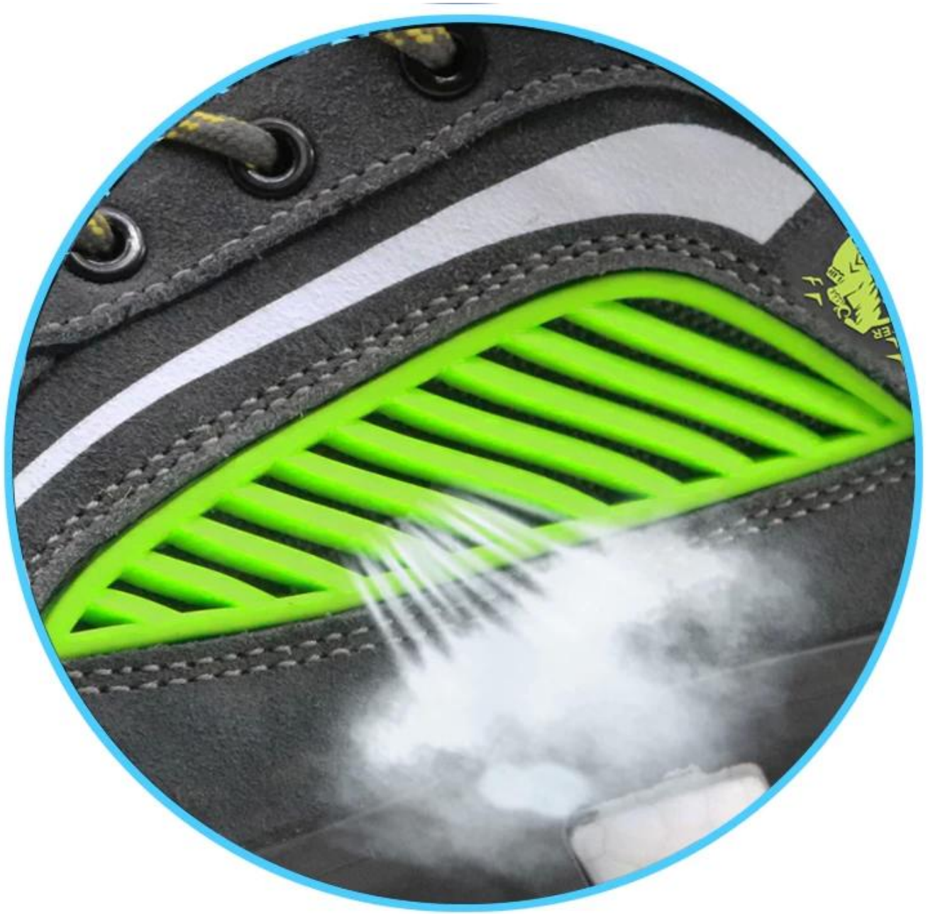
PVC Shark Gills design, Excellent Air Permeability