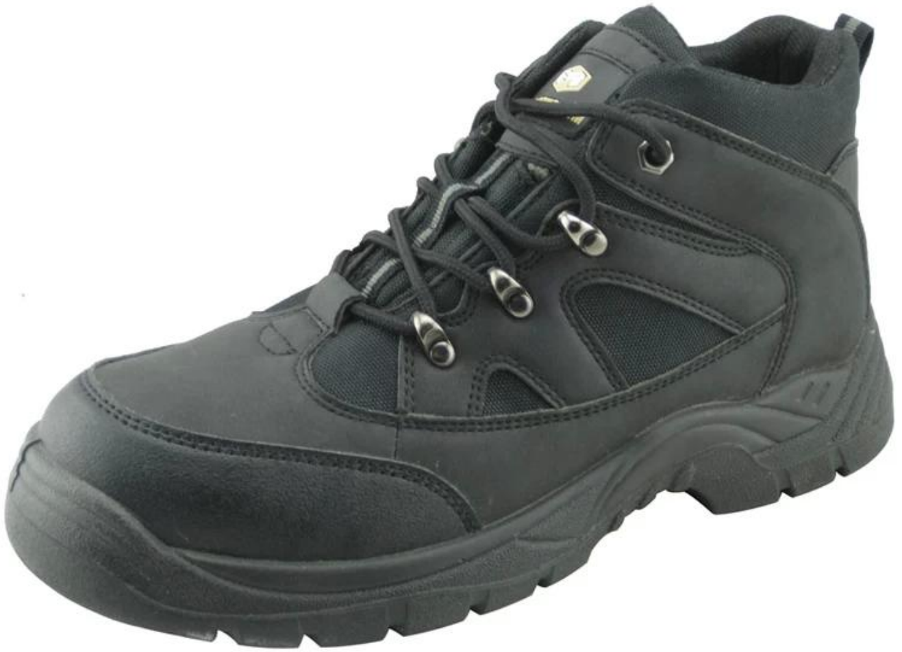
zapatos de seguridad Deportes única demostración: