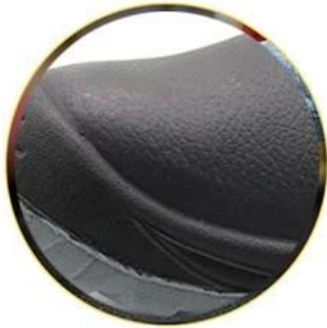
Waterproof leather upper

Removable metatomical EVA footbed provides long-lasting underfoot support and comfort.