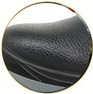
Waterproof leather upper

Removable metatomical EVA footbed provides long-lasting underfoot support and comfort.