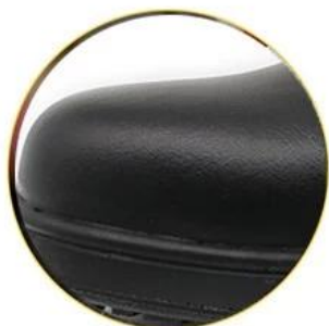
Waterproof leather upper

Removable metatomeal HI-POLY footbed provides long-lasting underfoot support and comfort.