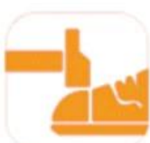
200 JOULE TOECAP