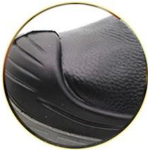
Waterproof genuine leather

Removable metatomeal EVA or HI-POLY footbed provides long-lasting underfoot support and comfort.