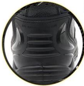
TPU SUPPORT STRUCTURE