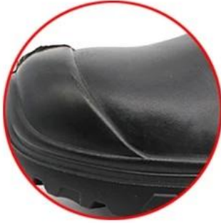
Waterproof cow leather upper

Removable metatological HI-POLY footbed provides long-lasting underfoot support and comfort.