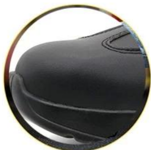
Waterproof leather upper

Removable metatomeal HI-POLY footbed provides long-lasting underfoot support and comfort.