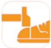
200 JOULE TOECAP