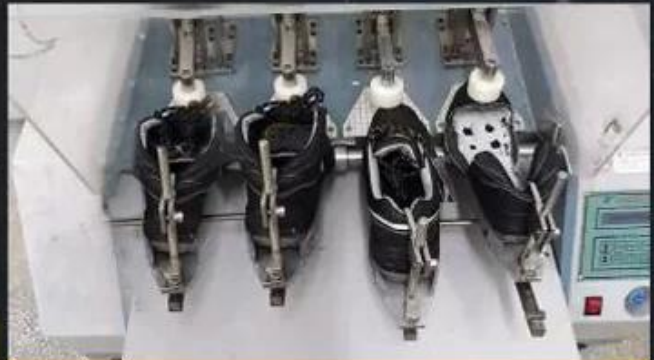
Flex Tester \geq 36,000 T