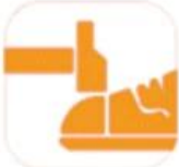
200 JOULE TOECAP