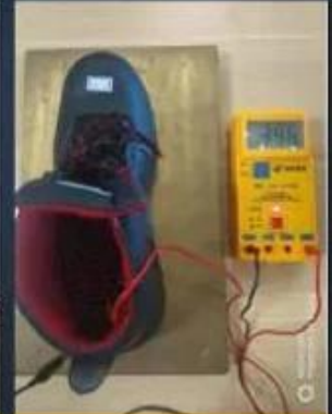
ESD Anti-Static Test