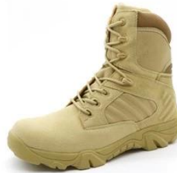
Military Army Boots