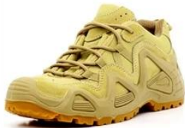
Safety Work Shoes

Link to PPE products website https://china-workwear.com