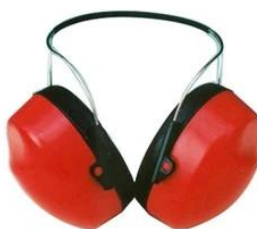
Ear muff/ Plugs