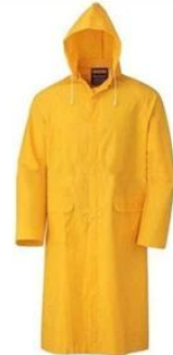
Rain Coat/ Suit