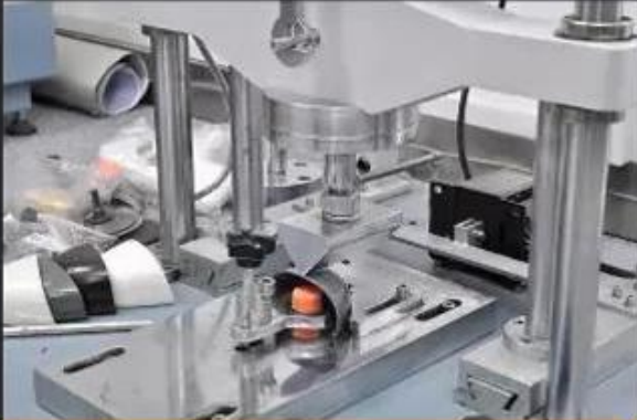
Toecap Test \geq 200 Joules