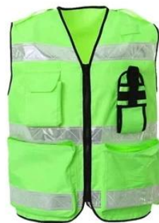
Reflective Safety Vest