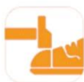
200 JOULE TOECAP