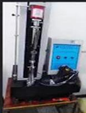
Bondness Test \geq 4.0 N/mm