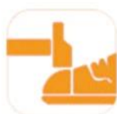
200 JOULE TOECAP