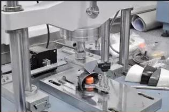
Toecap Test \geq 200 Joules