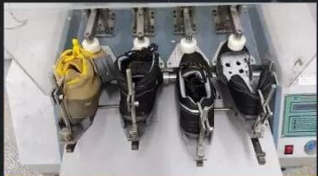
Flex Tester \geq 36,000 T