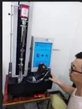
Bondness Test \geq 4.0 N/mm