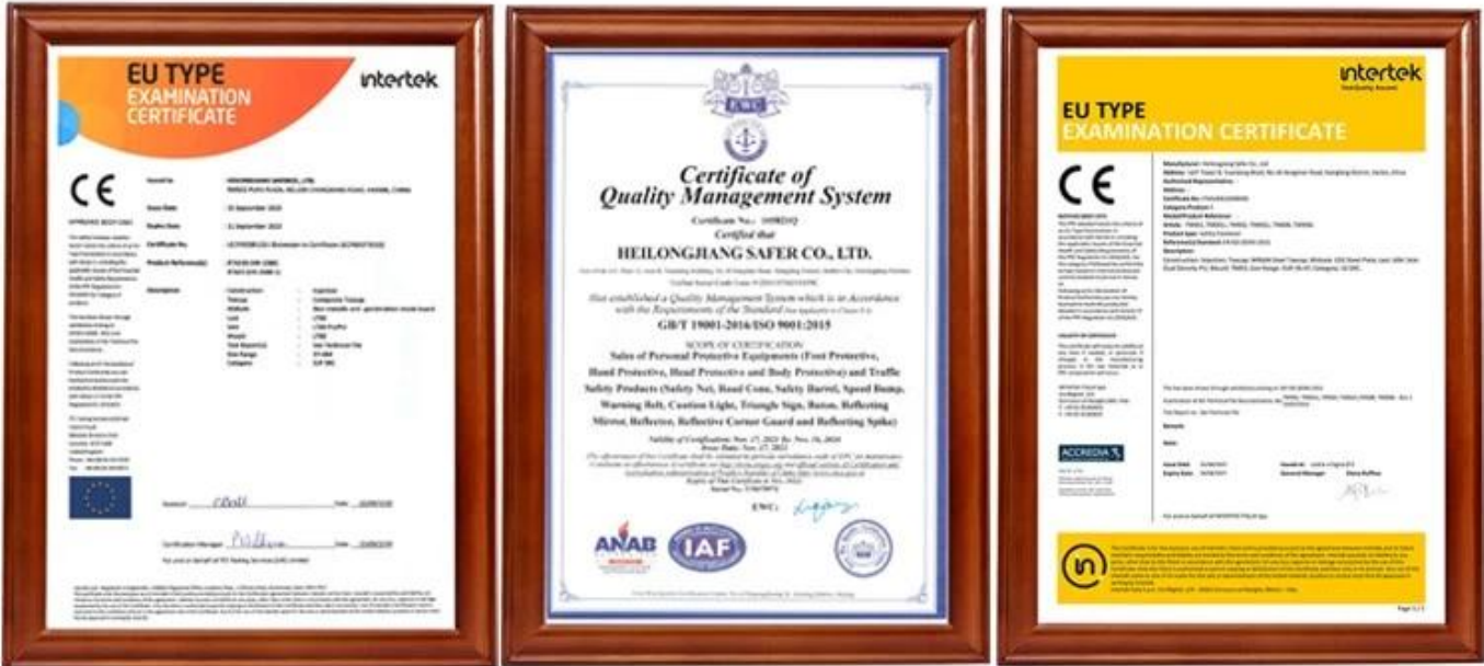
Figure 4.3: EU Type Examination Certificate and Certificate of Quality Management System for Heli Longjiang Safer Co., Ltd.

d'informations, n'hésitez pas à nous contacter, nous sommes toujours prêts ici.