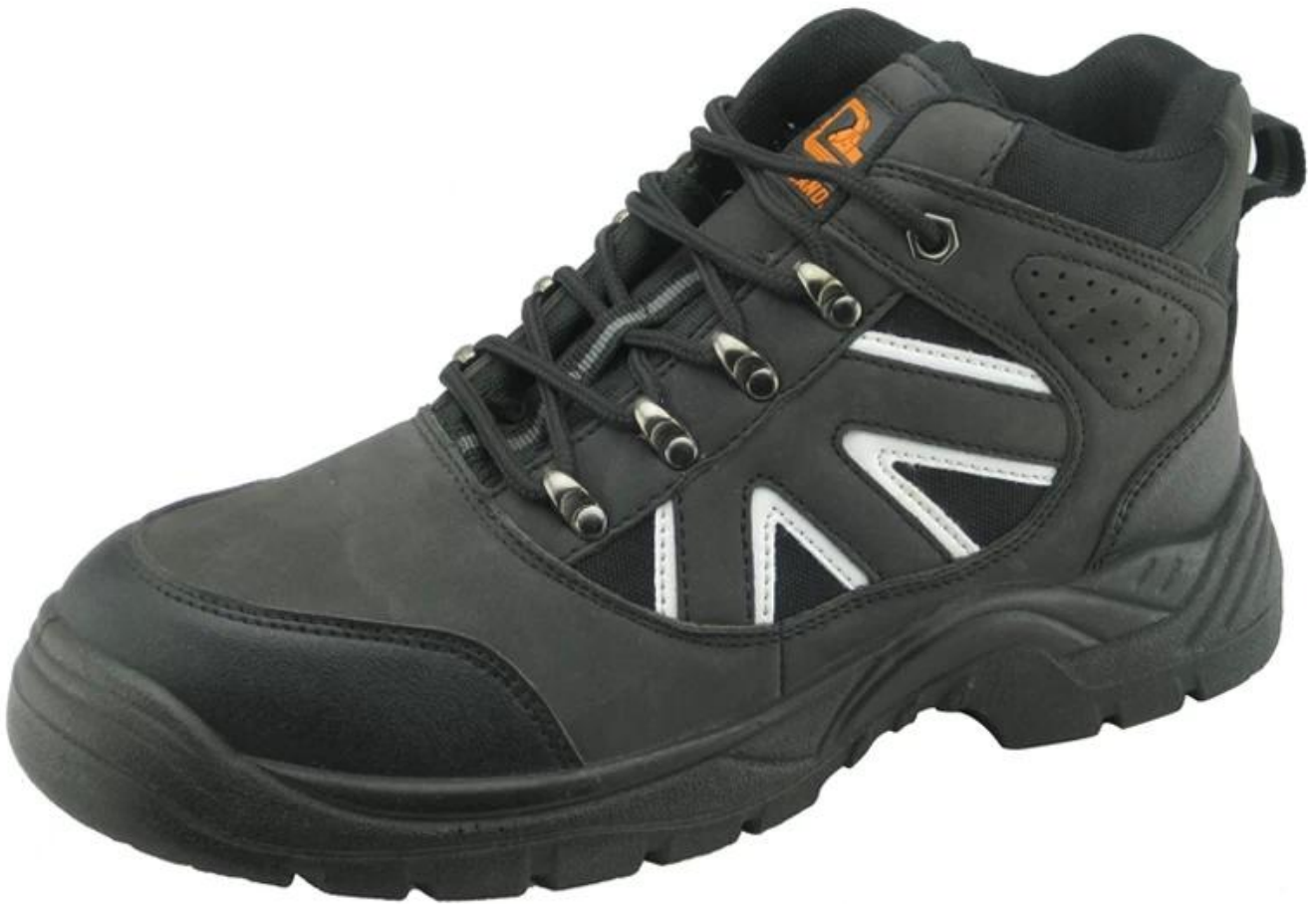
chaussures de sécurité industrielle montrent seule: