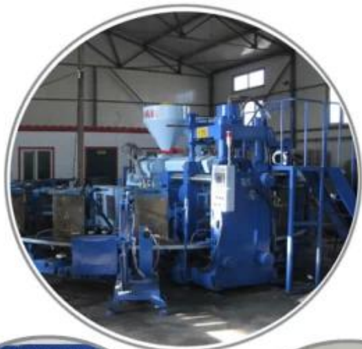
Automatic Injection Molding Machine

CE Issued to: HAINAN SAFETY PRODUCTS SAFETY CO., LTD. LINA VILLAGE, XINXIA TOWN, ACHANG DISTRICT, HAINAN, HEILONGJIANG PROVINCE, CHINA Issue Date: 16 September 2020 Expiry Date: 16 September 2023 APPROVED BODY: Intertek The only authorised body that has been notified by the Commission as a Notified Body for the purpose of the EU Type Examination of the products referred to in this certificate. Product Reference: SAFA SAFETY PRODUCTS Manufacturer: HAINAN SAFETY PRODUCTS SAFETY CO., LTD. Product Name SAFETY BOOTS Material PU/TPU Color Black Size 38-44 Weight 0.5kg Use Indoor Intertek Testing Services (UK) Limited 201, Old Derby Road, Luton, Bedfordshire, UK, LU2 9JF Author: [Signature] Date: 16/09/2020 Certification Manager: [Signature] Date: 16/09/2020