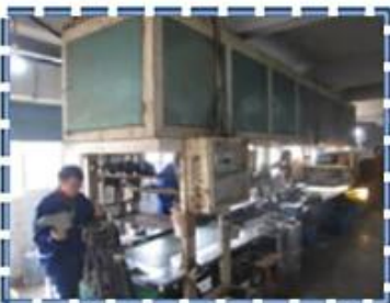
Heat - Setting